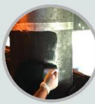
الکوپات (پوشش الکترود گرافیتی جهت کاهش ضریب مصرف)