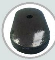
مولی پات (روانکار صفحات اسلاید گیت)