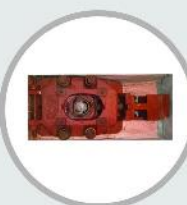
سیستم اسلاید گیت