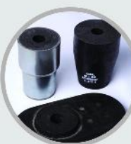
صفحه اسلاید گیت و نازل بیرونی و درونی