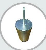
پرچینگ پلاگ توپي دمش گاز در پاتیل