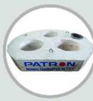
دلنپات (دلنای کوره قوس الکتریکی با جرم نانو باند)