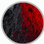
کستینگ پات (پودر ریخته گری)