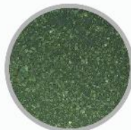
N.F.PAT (ماسه مجرای نازل)