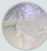
پاترومور (ملات سفید سیستم اسلاید گیت)