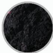
پاترکس (پودر پوشاننده سطح مذاب در پاتیل و تاندیش)