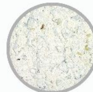
پاتروکس (انواع جرم های نسوز متوسط، کم و بدون سیمان)