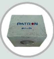
پات بلاک (ول بلوک پاتیل و پروس پلاگ)