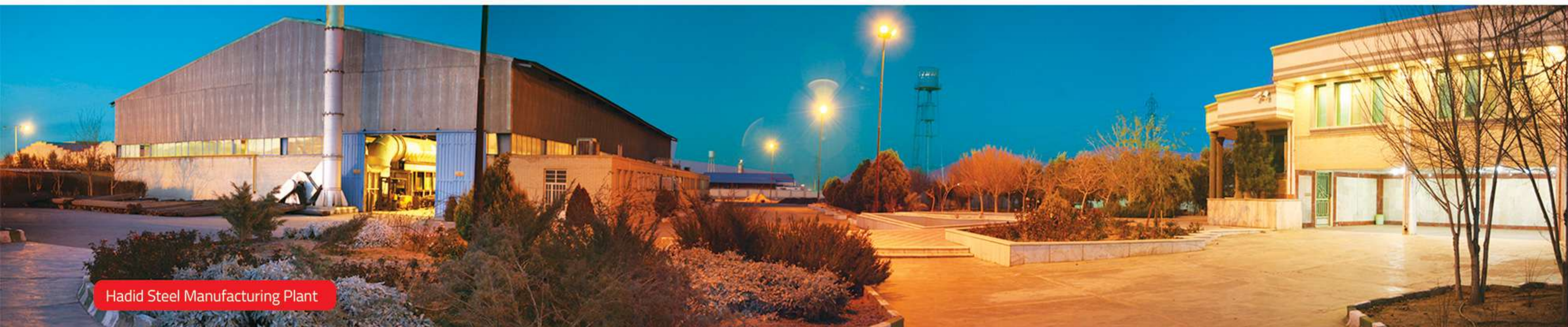
Hadid Steel Manufacturing Plant

ما آماده ایم تا با تعهدی بلند مدت، بر اساس پارامترهای اندازه گیری شده سایش و خردایش (به ازای هرتن) هزینه های عملیاتی را کاهش دهیم تا فرآیند فرآوری مواد معدنی، توجیه فنی-اقتصادی یابد.